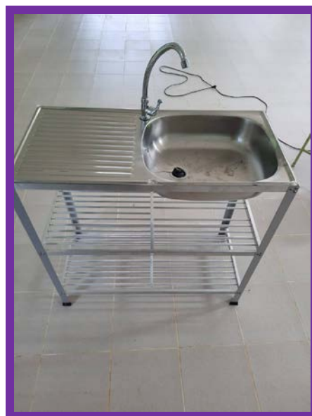
เตรียมความพร้อมในการดำเนินงานโครงการ