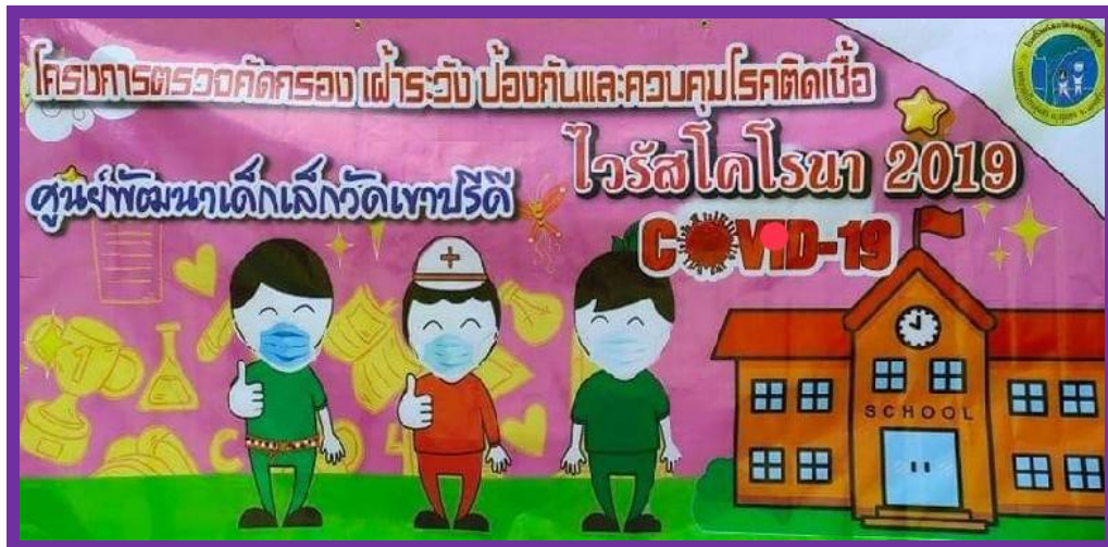
ป้ายโครงการ

จัดทำโครงการเฝ้าระวังป้องกันและควบคุมโรคติดเชื้อไวรัสโคโรนา ๒๐๑๙ (COVID-๑๙) เพื่อของบสนับสนุนจากกองทุนหลักประกันสุขภาพเทศบาลเมืองทุ่งสง ณ.ศูนย์พัฒนาเด็กเล็กเขาปรีดี วันที่ ๑๒ มกราคม - ๑๔ กันยายน ๒๕๖๔