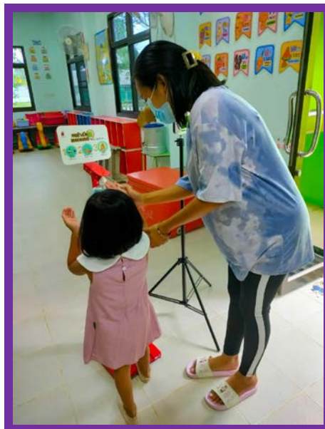
การคัดกรองและการรักษาระยะห่างของผู้ปกครองและนักเรียน