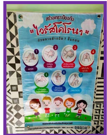
เตรียมความพร้อมในการดำเนินงานโครงการ