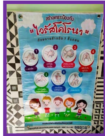
เตรียมความพร้อมในการดำเนินงานโครงการ